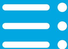
TABELA E PËRMBAJTJEVE